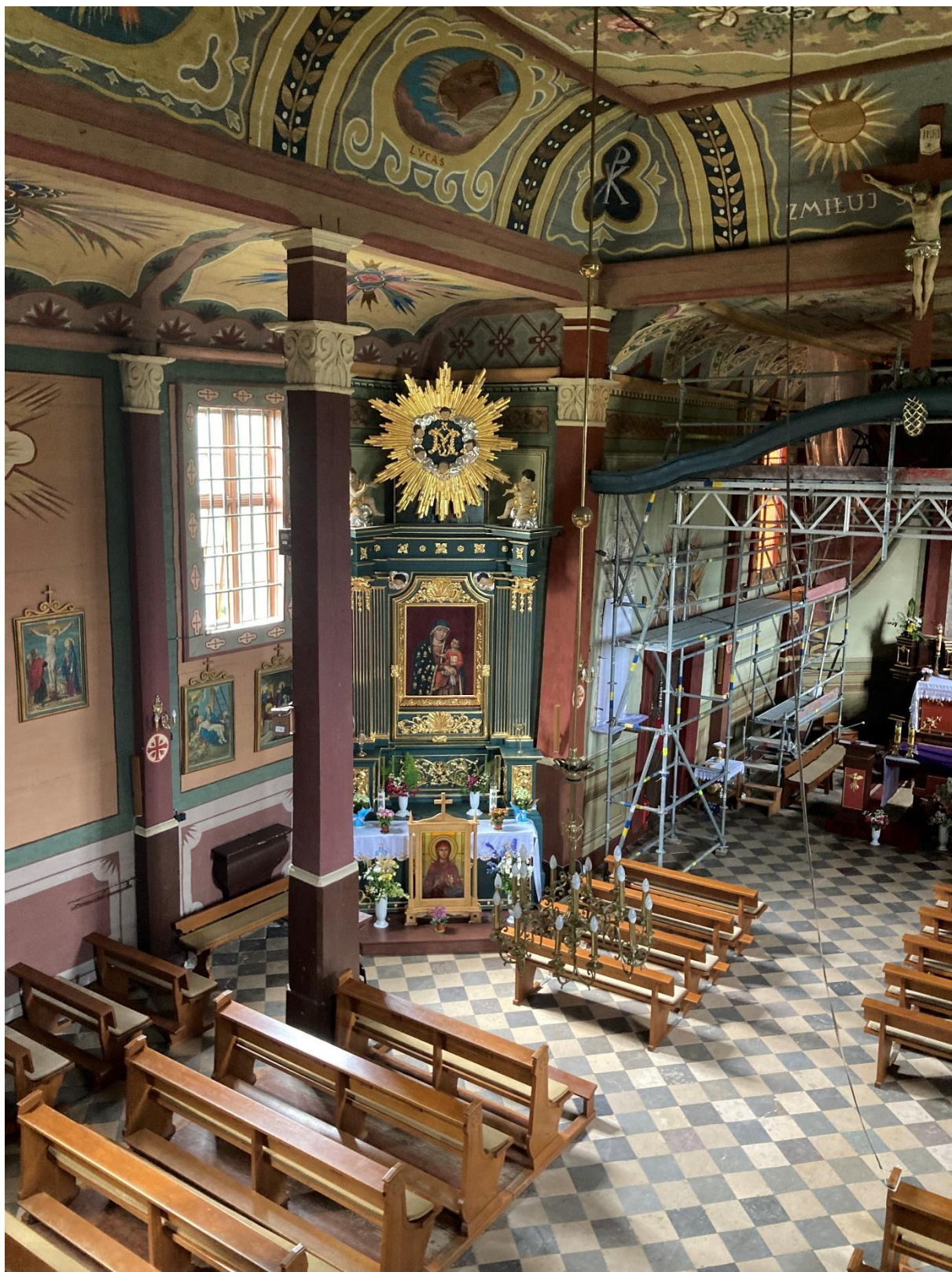
Fot. 2 Kościół pw. Św. Małgorzaty w Gorzkowie, nawa, widok narożnika sklepienia od strony północno-zachodniej.