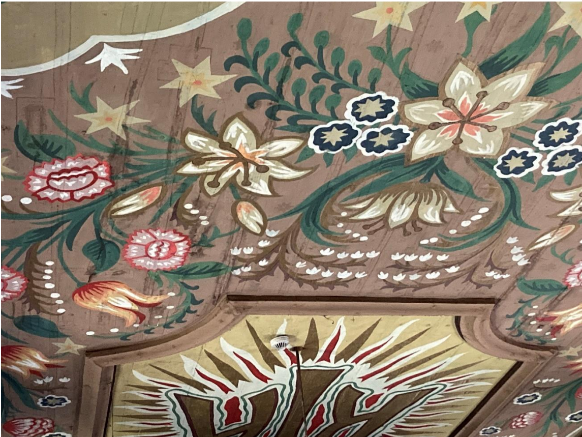
Fot. 3, Fot. 4 Kościół pw. Św. Małgorzaty w Gorzkowie, nawa, zbliżenia sklepienia, widoczne zacieki na warstwie malarskiej.