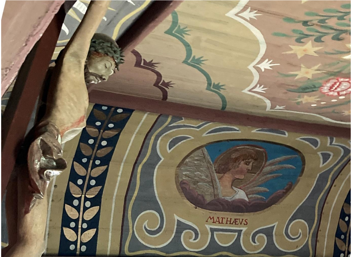
Fot. 7 Kościół pw. Św. Małgorzaty w Gorzkowie, nawa, zbliżenie fragmentu sklepienia z symbolem Św. Mateusza. Widoczny stan polichromii.