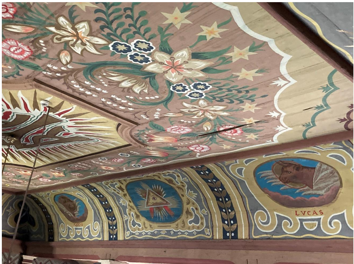
Fot. 5, Fot. 6 Kościół pw. Św. Małgorzaty w Gorzkwie, nawa, widoki części sklepienia z symbolami ewangelistów – od strony południowej i północnej.